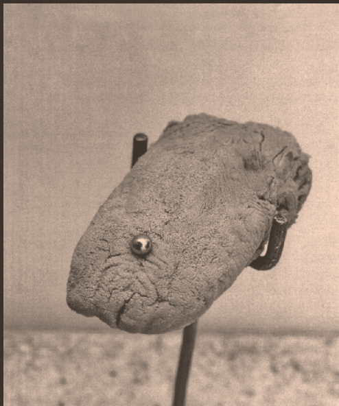
Teresa Margolles Lengua / Tongue, 2000 Object, human tongue Unique Courtesy of the artist and Galerie Peter Kilchmann, Zurich