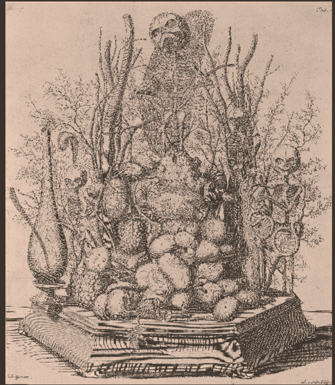
'Thesaurus anatomicus Tertius. Het derde anatomisch cabinet van Frederic Ruysch', Amsterdam, 1703. © Bijzondere Collecties, Universiteit van Amsterdam, OTM O 62 9052

Het preparaat is bekend van de gravure van Cornelis Huijberts, maar bestaat niet meer in tastbare vorm. Ruysch' anatomische collectie werd in 1717 aangekocht door Peter de Grote en is thans onderdeel van de Kunstkamera in Sint Petersburg.