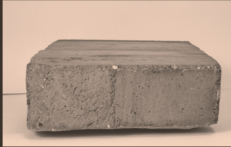
Teresa Margolles Entierro / Burial, 1999 Fetus in a block of cement 15.5 x 66 x 43 cm (6 1/8 x 26 x 16 7/8 in.) Exhibition view, “Muerte sin fin”, MMK Museum für Moderne Kunst, Frankfurt am Main, cur. Udo Kittelman, 2004.

In het Nederlandse strafrecht is er geen bepaling opgenomen met betrekking tot lijkschennis, dit in tegenstelling tot grafschennis (art. 149 Wetboek van Strafrecht (Sr)), welke de grafrust waarborgt.